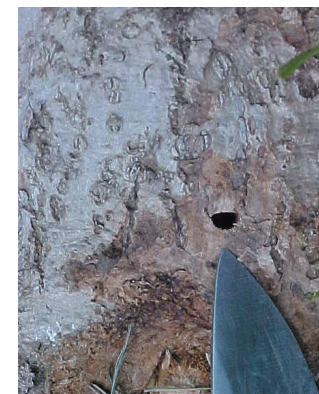
Daim Duab 3—Cov qhov tho tawm uas zoo li tus D yog tus EAB txoj kev qhia tias muaj kab.