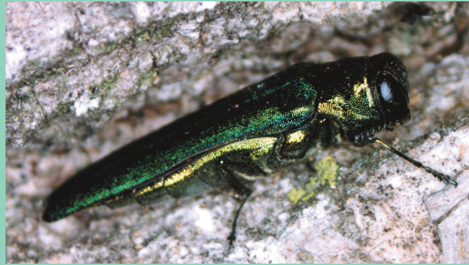
Daim Duab 10—Tus maum kab nteg qe rau cov ntoo tshauv ntawm cov kwj tawv ntoo.