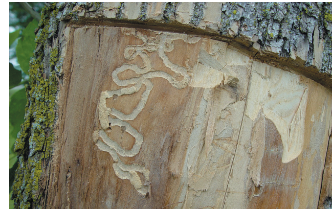
Daim Duab 2—Cov qhov zoo li tus S, yog cov menyuam kab EAB ua, muaj pawg lug rau cov ntoo tshauv uas twb raug cov kab lawm.