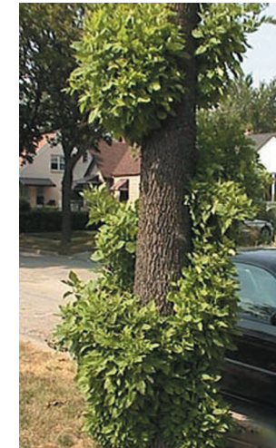
Daim Duab 4—Cov ceg hlav tawm yog cov uas yuav qhia tau tseeb tias tsoob ntoo muaj teeb meem.