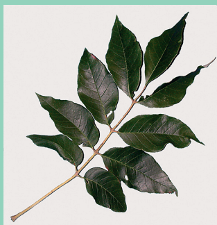
Daim Duab 8—Cov ntoo tshauv muaj ntau daim nplooj nyob ua ke ntawm ib tug kav, muaj li ntawm 5 daim mus rau 11 daim nplooj ua ke.