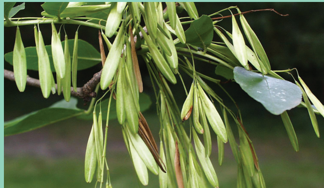
Daim Duab 6—Cov noob ntoo tshauv zoo li tus duav nquam nkoj thiab nrhiav tau nyob tej pawg ua ke; tej co ntoo tshauv tsis muaj noob.

Cov ntoo tshauv feem ntau yeej siv los cog rau sab nraum tibneeg tsev thiab qhov chaw ua hauj lwm thiab nrhiav tau nws tuaj qus hauv tej thaj tsam av uas siv los cog ntoo, ib ncig ntawm tus dej uas tseem muaj lossis tsis muaj dej, thiab hauv cov av nkos uas nyob qis. Nyob hauv Tebchaws Asmesliskas (United States), nws pom muaj cov ntoo tshauv nyob ntawm ib sab ntug tebchaw mus txog sab ntug tebchaw sab tov thiab nws yog 2 feem puas ntawm tag nrho cov ntoo. Tseem ceeb heev kom paub cov ntoo tshauv thaum piv rau lwm cov ntoo vim tias tus EAB noj tag nrho txhua hom ntoo tshauv.