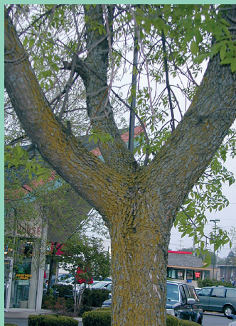
Daim Duab 7—Cov ntoo tshauv muaj cov ceg uas nyob ib sab ntawm lwm ceg, cuag li koj saib hauv daim iav. Qhov no hu ua ceg zoo tib yam nyob ob sab.

Cov duab lawv qab no yog qhia txog ib co xeeb ceem ntawm cov ntoo tshauv.